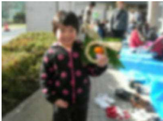
しめ縄づくり たくさん子ども達が 参加していました。