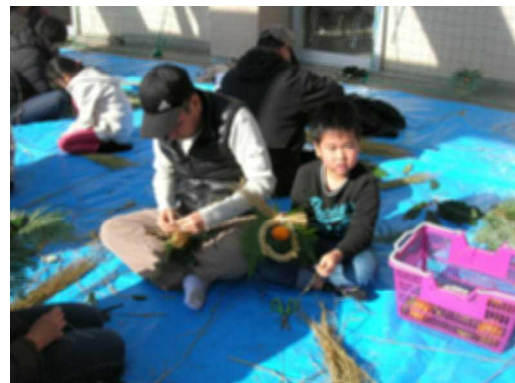
しめ縄づくり お父さんやお母さん といっしょに作ります

みんなとても上手に作っていました。学校のしめ縄も地域のかたに作っていただきました。ありがとうございました。玄関に飾らせていただきました。