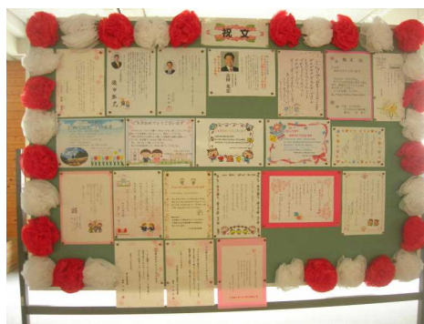
お祝いのメッセージもたくさんきています。