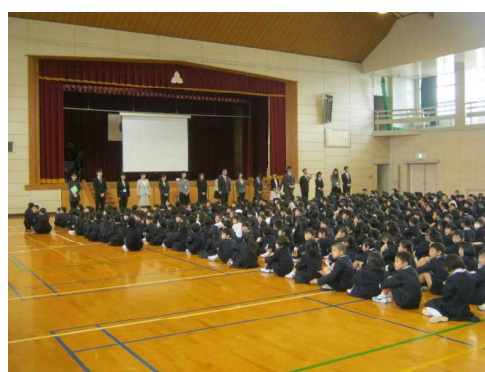
担任発表：みんなうれしそうな表情でした。