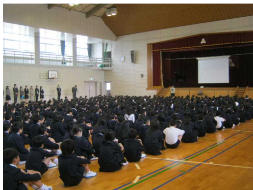
校長の話：集中して聴いていました。