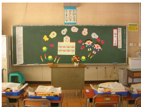
入学式の準備もできました。