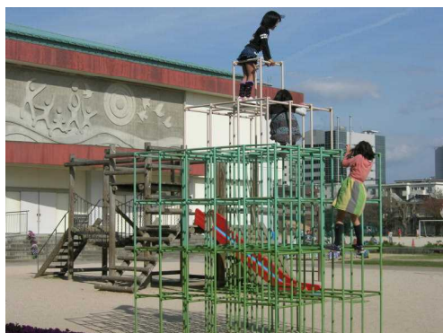
放課後もたくさんの子ども達が