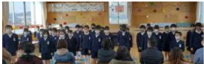
「育てくれて、ありがとう！」(4年生・『二分の一成人式』)

1年間の節目である年度末は、それを学ぶ大きなチャンスです。例えば、暑い日も寒い日も街頭に立ち続けてくださっているまもり隊の方に。いつも優しく接してくれた6年生に。自分のことをいつも気にかけてくれているクラスの友だちに。いろいろなことを教えてくれた担任の先生に。そして何より、自分を大切に育ててくれている家族に…。この機会に、子どもたちには、お世話になった全ての人に“ありがとう”を伝えてほしい、そして、感謝の気持ちを伝え合うことの心地よさを感じてほしいと思います。