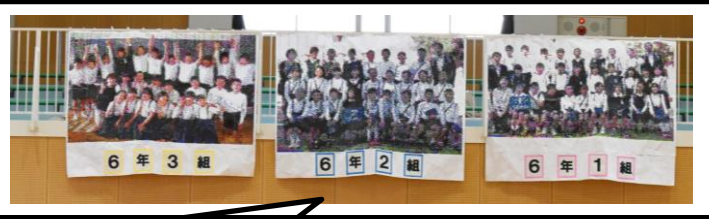
写真に見えるでしょう？ 実は、1cmのマスキを8色のペンで塗って作ったモザイクアートなのです。5年生の努力の結晶です！

5年生を中心にして、下級生が6年生に感謝の心を込めて「6年生を送る会」を開催しました。1～4年生は、精一杯の劇や歌や踊りを披露し、5年生は、6年生のこれまでの写真からスライドショーを作成して、発表しました。垂れ幕やモザイクアートも感動を呼びました。下級生の心が6年生にもしっかりと伝わり、笑顔いっぱいの、心温まる会になりました。