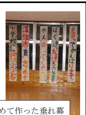
下級生が心を込めて作った垂れ幕