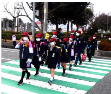
新しい登校班で登校する様子