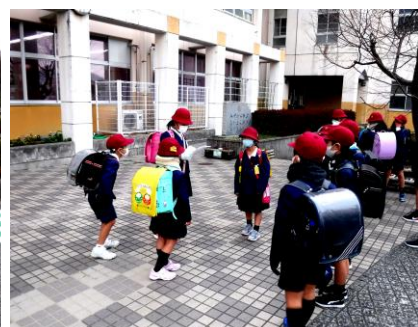
登校について振り返っている様子