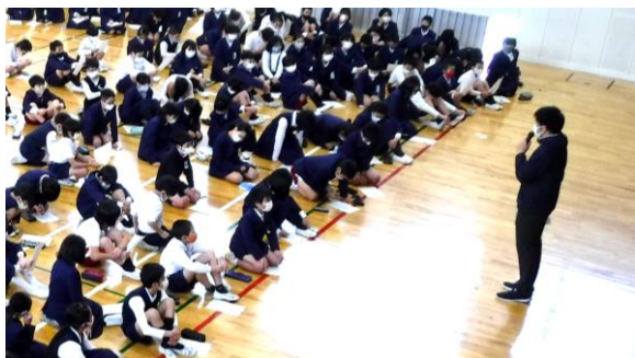
交通主任の先生の話をお聴きしている新班長・副班長

これから6年生には、安全な登校ができるように、新しい班長や副班長を温かく見守り、そしてサポートし、バトンをしっかりと渡してもらいたいと思います。