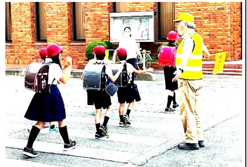
見守り隊の方に見守られながら、横断歩道を渡っている様子

夏休みも地域の行事などいろいろな場で子どもたちがお世話になることと思います。よろしくお祈りします。