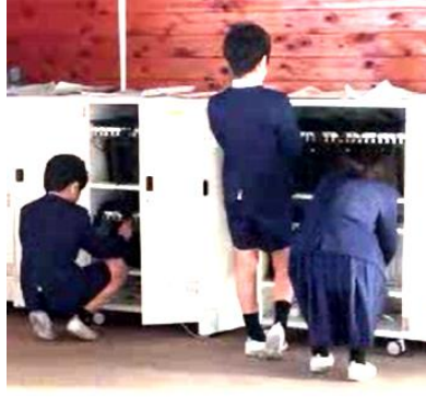
タブレットを取り出す5年生

低学年の子どもたちも、写真を見るなど、学年に応じて、タブレットを上手に活用しています。