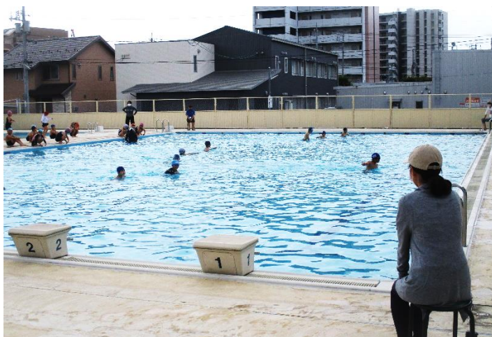
保護者のボランティアの皆様が、子どもたちの様子を見守ってくださっています。

本校では、このようなボランティアの皆様を「みなみっこサポーター」と呼んでいます。