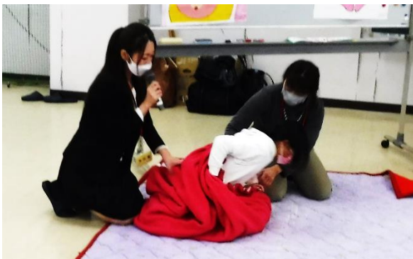
産道を通して生まれてくる体験をしました。産道を出るのはたいへんでした。赤ちゃんもがんばっていることが分かりました。

小学4年生という、子どもたちの身体が変化し始める大切な時期に、命の誕生に携わっている助産師としての立場からお話しさせていただきました。お子様一人ひとりが自分は繋いでいく命のもとを持つ大事な身体であると認識し、自分のことも友だちのことも大切にしようと、改めて考えるきっかけになっていましたら幸いです。