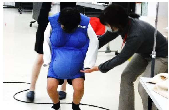
妊婦体験をしました。重くて歩くだけでもたいへんなのに、足を曲げるのはもっとたいへんでした。