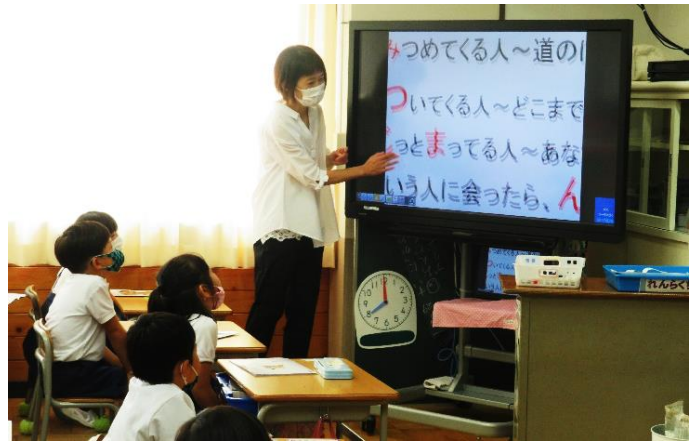
電子黒板を見ながら、お話を聞いている様子