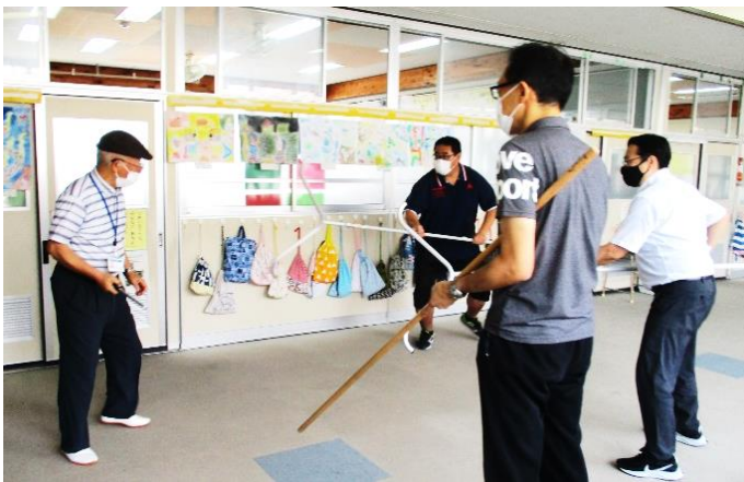
駆けつけた職員と不審者が対峙している様子

少年安全サポーターやスクールガードリーダーの皆様、2回にわたり、ご指導いただき、ありがとうございました。