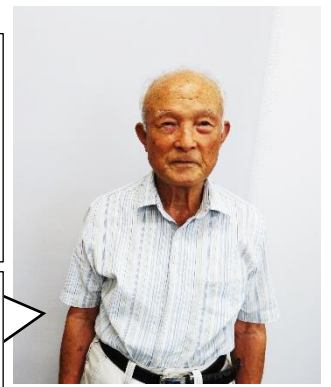
おごおり 地域づくり協議会

今までは大人に対して歴史の話をしてきた。子どもたちには初めてのことで、小郡の昔の地理は難しかったかなと思いました。小郡南小学校の地域は昔海だったことを話すと驚いていた。子どもたちと一緒に学習をして、多いに元気をいただいた。