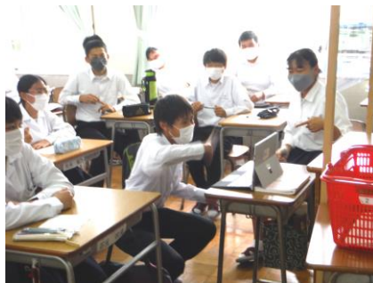
各教室で話し合い、回答 「今回は、海派が多かったです」