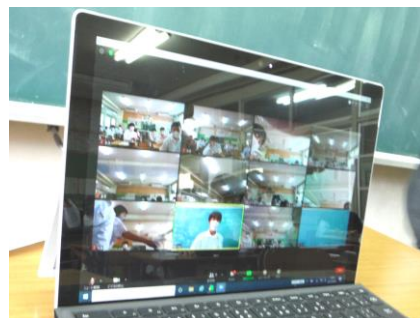
各教室の画面には全教室の様子映っています。