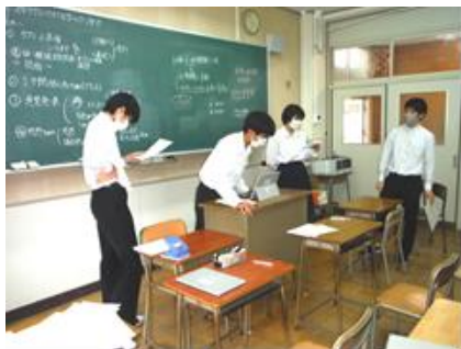
本部(生徒会室)から指示 「旅行に行くなら海か？山か？」

今、生徒会執行部では7月に予定している生徒総会のあり方を考えています。コロナ対策のため、なるべく体育館に全校生徒が集合せずに実施できる方法を検討してきました。そこで出た 各教室をZoomのweb会議システムでつなぎ意見交換 するというアイデアを、今回の全校集会で検証してみました。機器の操作や会の進め方などいくつかの課題が見えてきたので、修正をして生徒総会に臨みます。これからの 生徒会の挑戦に期待 しています。