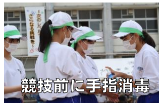
競技前に手指消毒