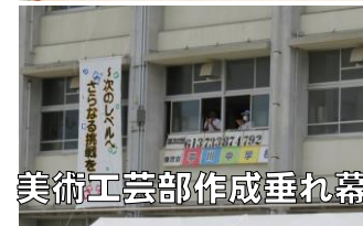
美術工芸部作成垂れ幕