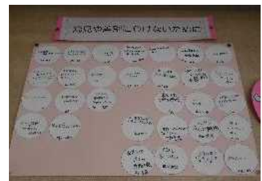
「偏見や差別に負けない」