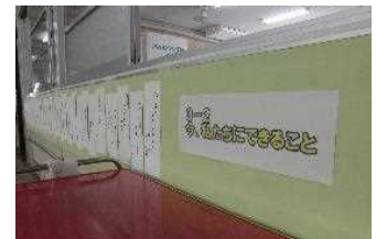
3年生廊下掲示宣言・標語