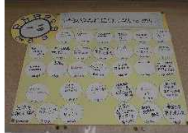
「不安や恐れに負けない」