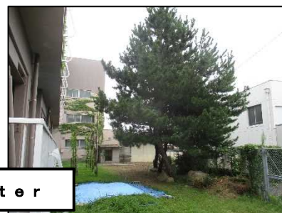
【木の伐採～南校舎裏～】