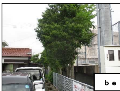
【木の伐採～プール横～】

薄暗かった南校舎裏が明るくなり、蚊の発生などの心配がなくなりそうです。 落葉による水路の詰まりなどがなくなりそうです。