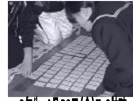
2年生 1月26日(金)5・6校時

恒例の百人一首大会です。12月から歌を覚えて準備をしてきました。当日は実行委員によって会が運営されました。