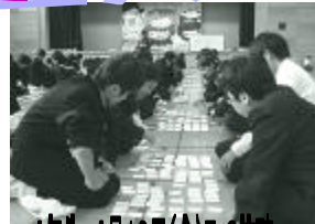
1年生 1月19日(金)5・6校時