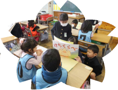
入学児童就学説明会