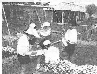
4年理科:小郡小の春探し