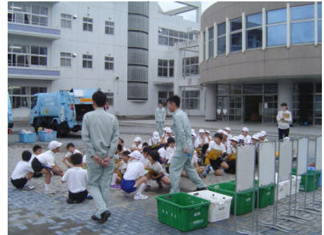
4年生 パッカー車の見学