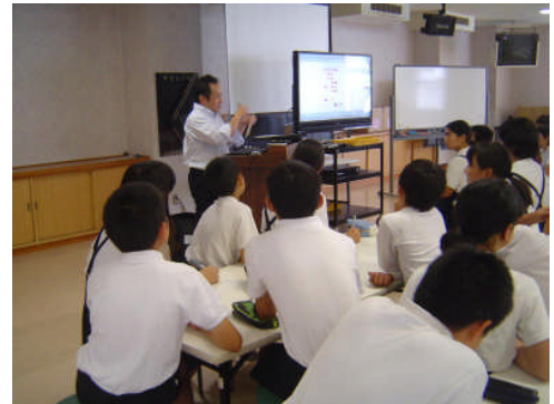
6年生 キャリア教育の授業

今後におきましても、子どもたちのよりよい成長のために多くの方々のお力を借りながら学校運営を進めていきたいと思っておりますので、どうぞよろしくお願いいたします。