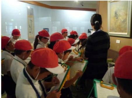
3年生 小郡文化資料館