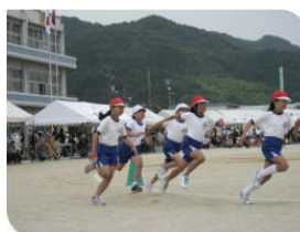
5年生(徒競走) 「GO! GO! ゴー！」