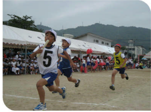
「赤白対抗リレー(上学年)」