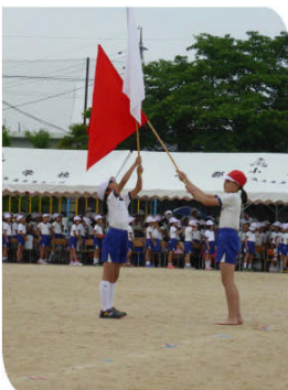
閉会式は、雨のため 児童はテントの中でした。 団旗による赤白あいさつ。