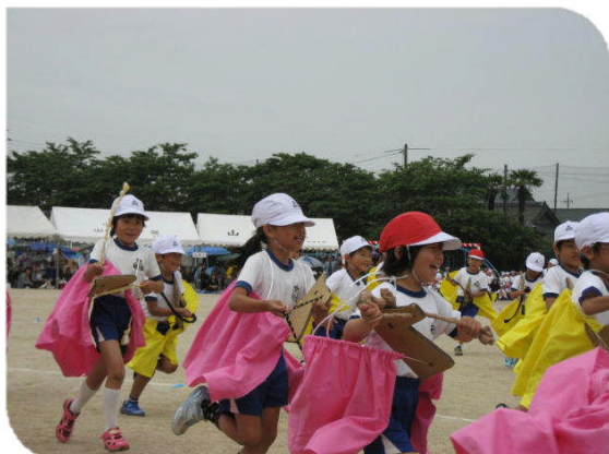
1・2年生の表現「小郡小あらうま」 ＜かわいい あらうまが 運動場を駆け巡りました。＞

天気が心配される中、小郡小学校春季大運動会を無事終えることができました。小雨のため「小郡音頭」と「全校玉入れ」は実施しませんでした。昼食を後回しにし、12時45分ごろ閉会式を終えることができました。児童が、校舎内に入ってから雨脚が強くなり、小郡小学校の強運を感じました。