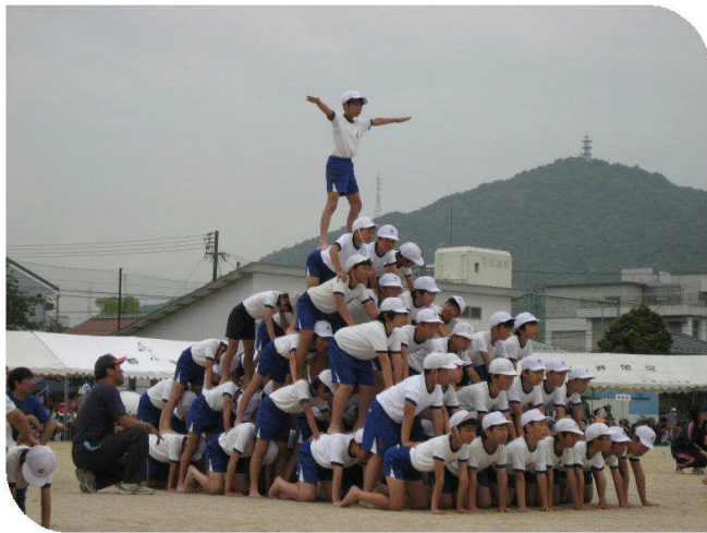
5・6年生の表現 「組体操 ファンタジア」 ＜練習の成果により 見事にピラミッドが完成しました。＞