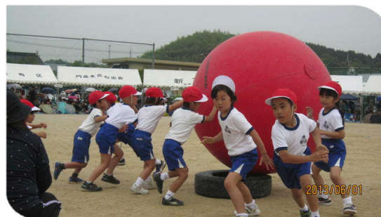
1・2年生「あっちへころりん こっちへころりん」 ＜大玉は、なかなか思い通りになりません。＞