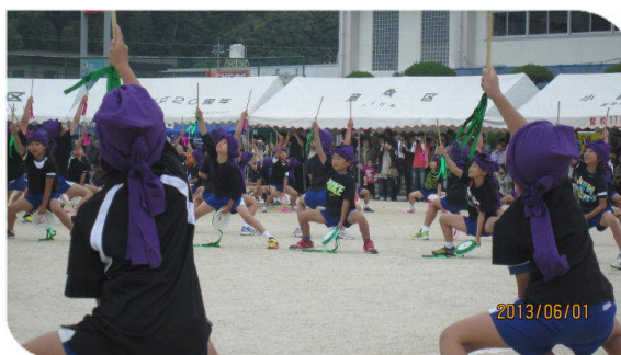
3・4年生の表現 「2013エイサー ～沖縄の風～」 ＜衣装もポーズもきまっています。＞