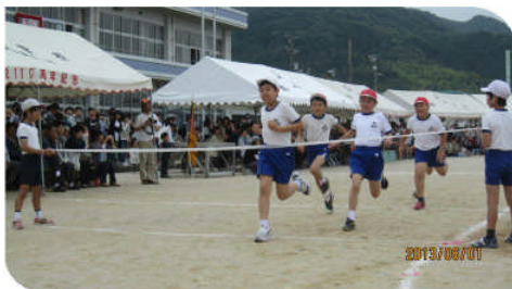
6年生(徒競走) 「LAST RUN」 ＜力強い走りでした。＞