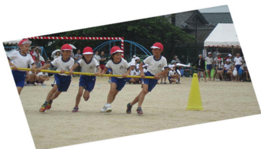
3・4年生「小郡小タイフーン」 ＜タイフーンが雨を吹き飛ばしました。＞