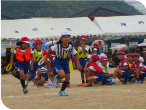
「赤白対抗リレー(下学年)」