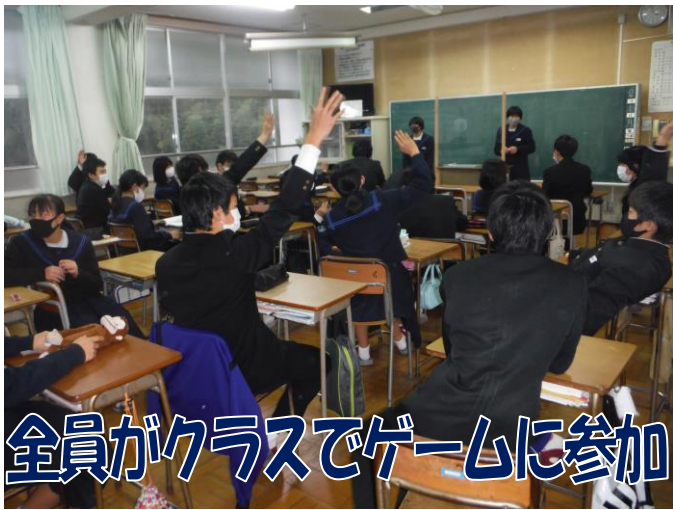
全員がクラスでゲームに参加