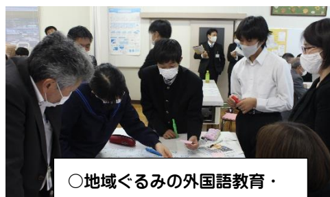
○地域ぐるみの外国語教育・国際理解教育の企画・実施