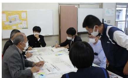
○SNSへの依存の原因の分析<<なぜ、依存するのか？不適切な使用とは？>> ○地域ぐるみで「生活習慣の乱れ」を正す取組の企画・実施