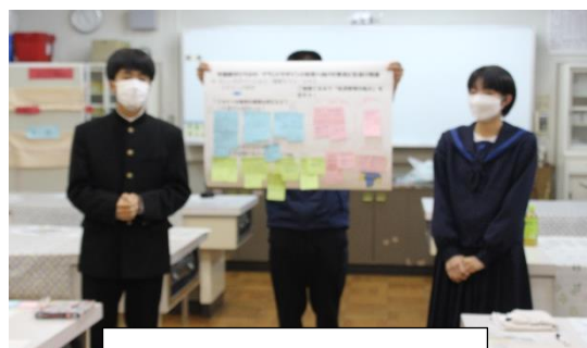
話し合いの後で全体に発表

より良い平川中学校をつくるために、何ができるかを地域の人と一緒に生徒が考えました。話し合った内容のいくつかを実行に移せるといいですね！