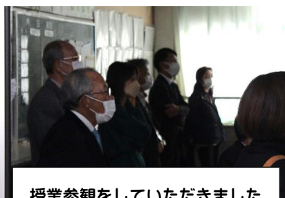
授業参観をしていただきました

よりよい平川中学校にしていくために、地域の方、教職員、生徒が一緒になって話し合う、「学校運営協議会」を開催しました。