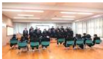
卒業生を送る会での在校生の合唱