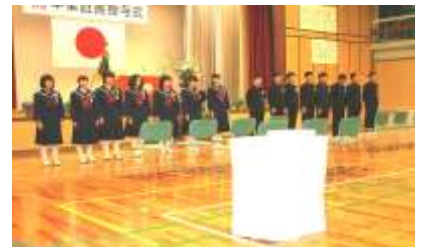
感謝の気持ちを込めた卒業生の合唱

役や係が人をつくると言います。置かれた場所で精一杯咲こうとした人が、美しく見える所以です。ぜひ、置かれた学年の意味を自覚し、有意義な次の年度を迎えてほしいと願っています。そして、友愛の心で仲間を大切に、切磋琢磨にふさわしい仲間づくり、集団づくり、学校づくりに力を発揮してほしいと期待しています。